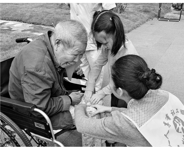
社工和小朋友帮老人按摩,并和老人聊家常。