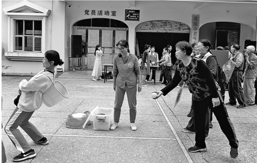
北流市老年大学的学员在开心游戏。

本报北流讯 10月23日,在北流市老年大学,北流市图书馆与老年大学联合举办“温情重阳 乐享银龄”关爱老人志愿服务活动。