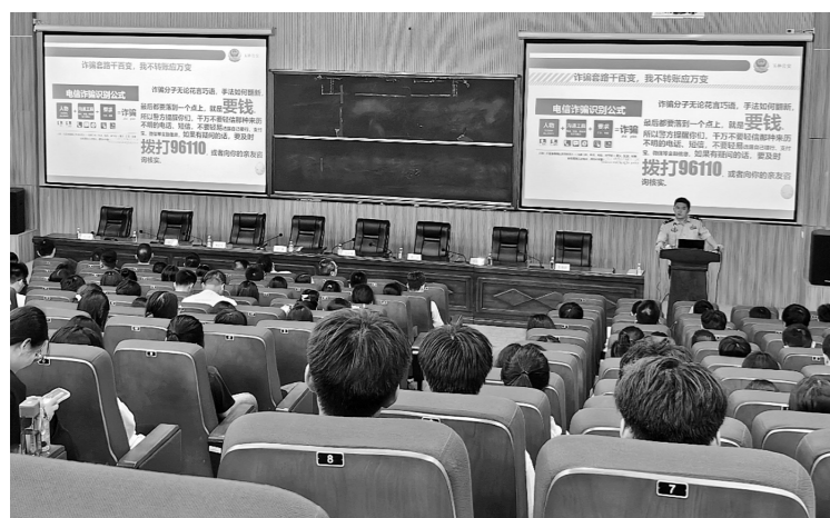
反诈宣传进校园活动现场。

本次银校警联合开展金融知识进校园宣传活动,有效提高了大学生防范电信网络诈骗的能力,他们也将成为校园反诈行动的宣传者、引导者、推动者,为守住校园反诈前沿阵地贡献青春力量。(庞雪锋)